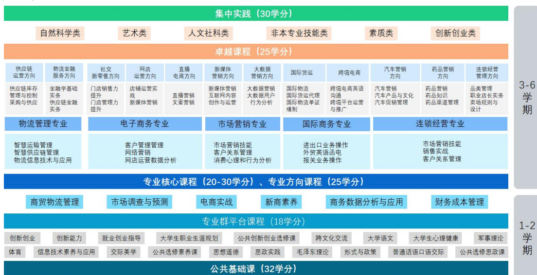
图2 学分导航，大平台多方向培养的课程体系

第一学年，按照专业大类培养，所有学生不分专业共同学习统开专业平台课。从第二学年开始，学生根据自己的专业学习兴趣自由选择专业群内某一专业，开始学习专业核心课和方向课。为激励学生学习，拓展复合型能力，学校制定了下述学分制规定：一是学生可以在完成专业必修课的基础上，依据自身定位和偏好跨专业选择相关课程；二是制定灵活的学分置换办法，除了专业核心课、思政课之外，大赛成绩、自学考试成绩、社会活动等都可以与人才培养方案中其他课程进行置换。