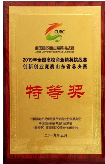
图4 学生竞赛获得特等奖